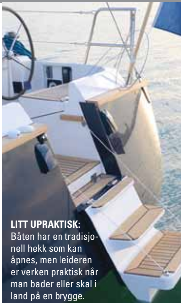
LITT UPRAKTISK: Båten har en tradisjonell hekk som kan åpnes, men leideren er verken praktisk når man bader eller skal i land på en brygge.

Akterlugarene har litt smale køyer. Mellom køyene er det et teknisk rom hvor det er plass til generator eller annet utstyr. På oppdaterte tegninger er det tekniske rommet krympet, og køyene er gjort