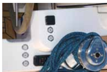
KNAPPER: Testbåten var full av automatikk. Seilene trimmes ved hjelp av elektriske vinsjer. Her er også kontroll for autopilot.

eller en jolle, men det er ingen god løsning for bading.