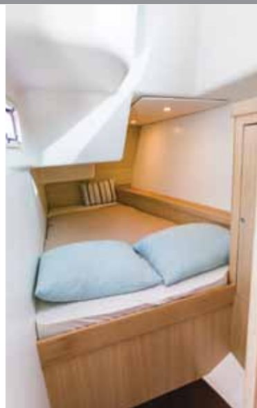
TRANG: Akterlugarene er Contests svakhet. Køyene er smale, det er lite naturlig lys og dårlig luftemuligheter.