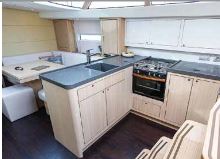
BYSSA: Contest 42CS byr på en enorm bysse. Det er godt med alburom og stueplass, men bare en oppvaskkum.