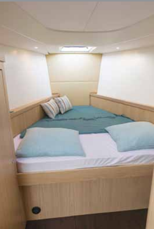
EIERLUGAR: Lugaren forut har mange ulike løsninger. Testbåten hadde tradisjonell køye med delt bad. Jeg likte løsningen med badet helt forut bedre.