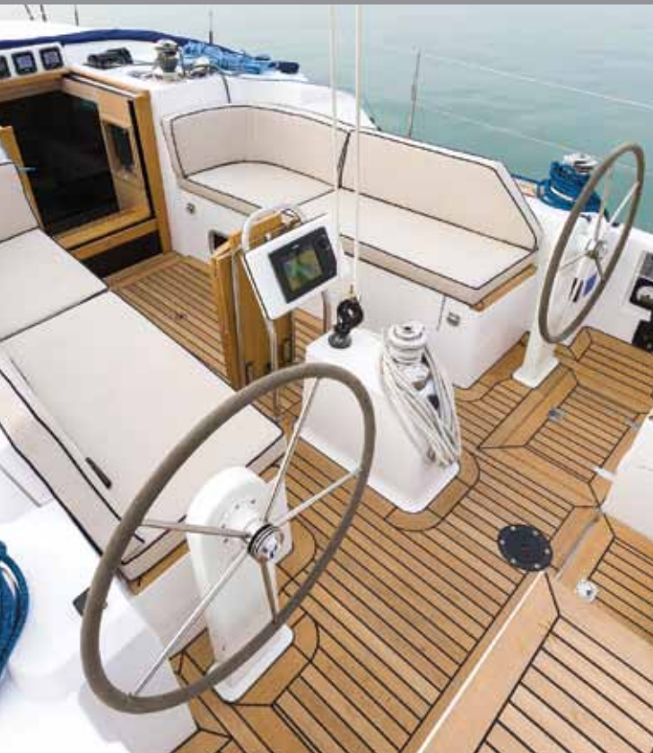
SOLO: Testbåten har «shorthand» cockpit. Storseilskjøtet går direkte til en sentral vinsj. Griperekke på rattpidestallen savnes. Likeså lister til foten for rormannen.

Til babord i salongen er det en stor u-sofa. Salongbordet kan vippes over slik at størrelsen dobles. Under salongbordet er det lagringsplass til noen blader, eller en iPad.