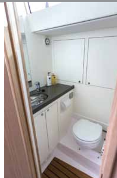
BAD: Contest 42 CS har et stort og elegant bad, men det mangler luker som kan åpnes. Dette er det aktre badet som er ekstra stort på denne modellen.